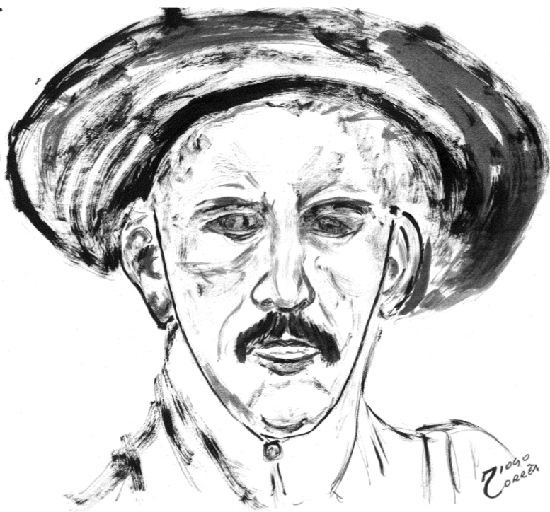
Ilustração: Don Jayme Caetano Braun – Diogo Corrêa