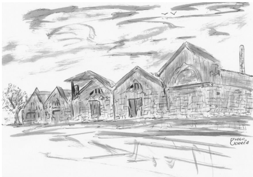
Ilustração: Matadouro Outra Perspectiva – Diogo Corrêa