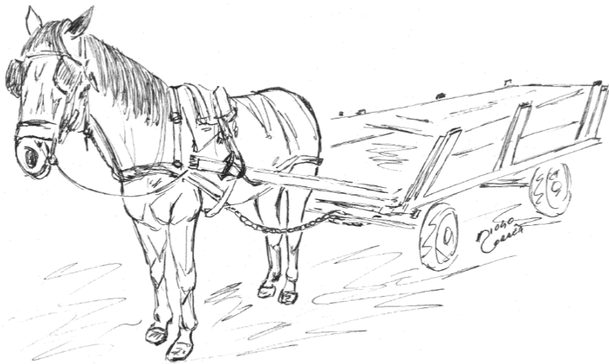
Ilustração: A Carroça – Diogo Corrêa