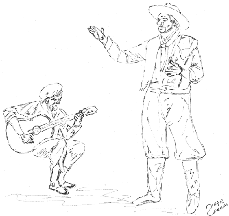
Ilustração: Declamador e Amadrinhador – Diogo Corrêa