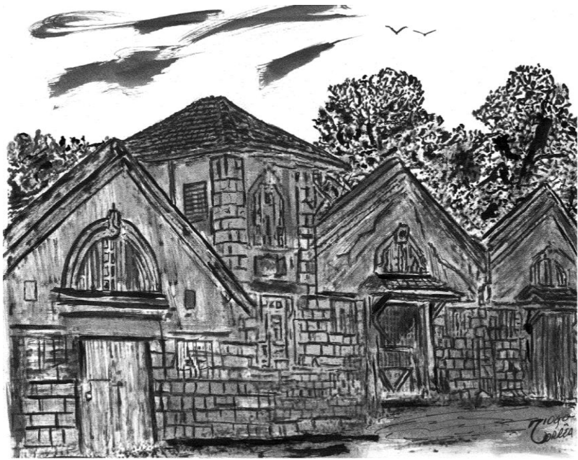
Ilustração: Matadouro – Diogo Corrêa