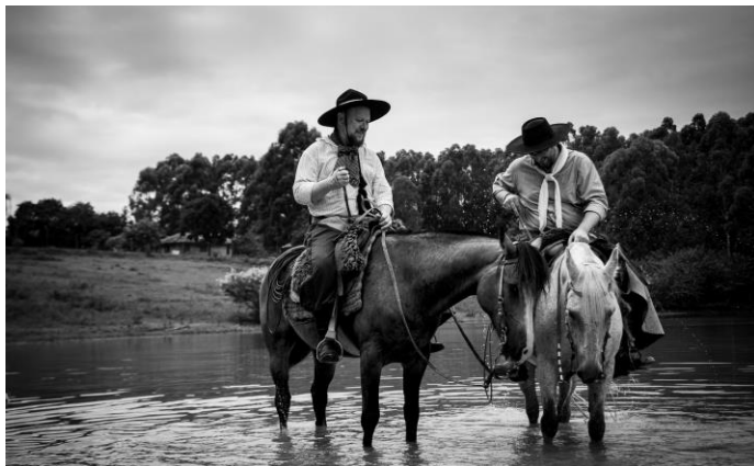
Duas almas irmãs

identifica a simplicidade e autenticidade do povo que tem amor a suas tradições e honra sua identidade.