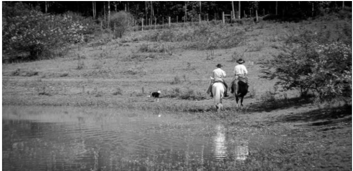
Dois irmãos de alma

ferro” daquele campeiro que pra mim fez História.