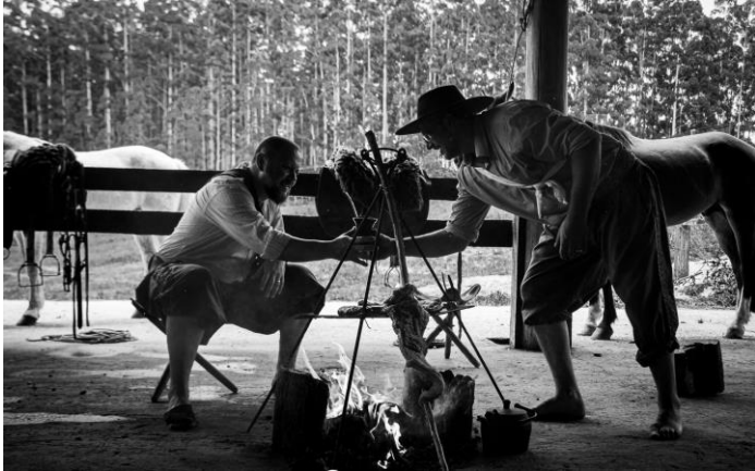
Duas almas irmãs

Ao pé do fogo, nosso capataz atento vê surgirem as prosas que retratam tudo em que acreditamos.