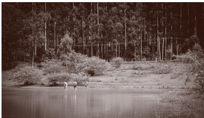
Da nossa tradição